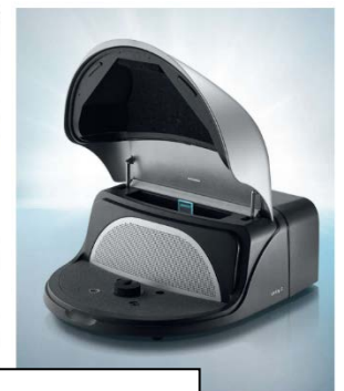
聴力・特性計測システム UNITY 3