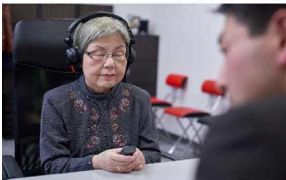
実際に補聴器を装着した状態で音圧測定